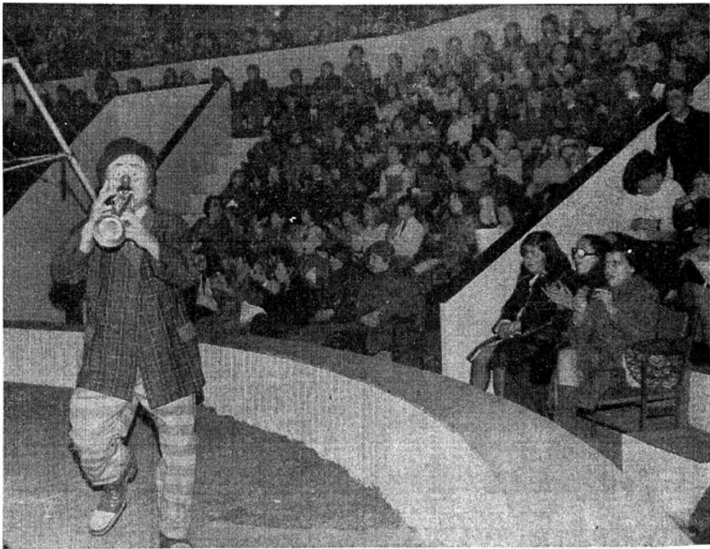
Hier après-midi, « Culbuto », applaudi par des milliers de scolaires.