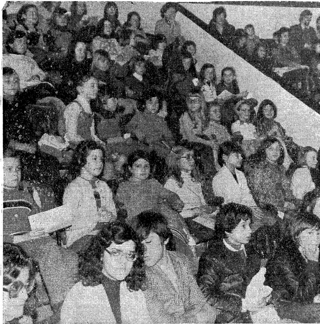
Un public sensibilisé au cirque.