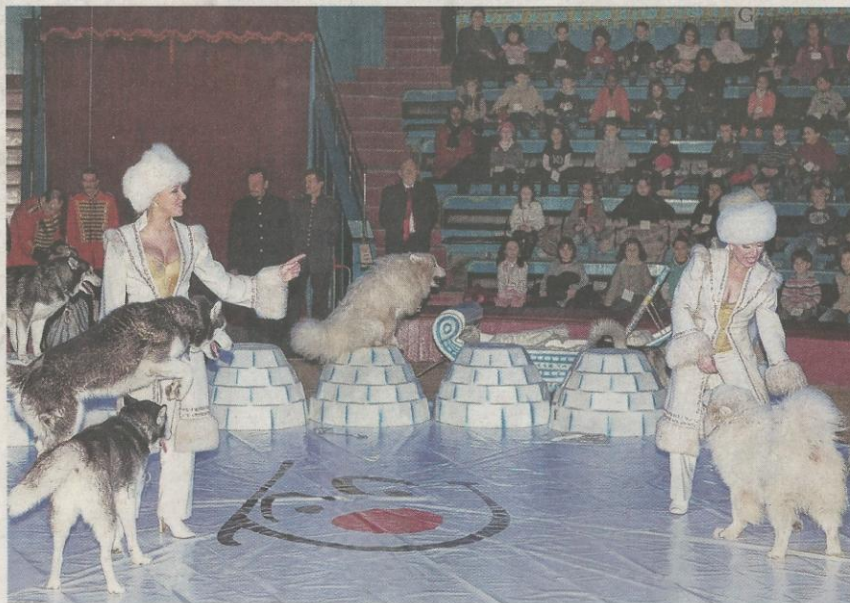
Huit séances tout public sont prévues à partir de ce samedi.

Un spectacle conçu pour seulement deux mois chaque année (janvier à Reims, février à Sin-le-Noble (près Douai), préservé au fil des années par des bénévoles entièrement attachés à sa cause. Le créateur Hugues Hotier sait pouvoir compter sur ceux de Reims en fêtes, sur ses proches, sur sa famille, en particulier sur