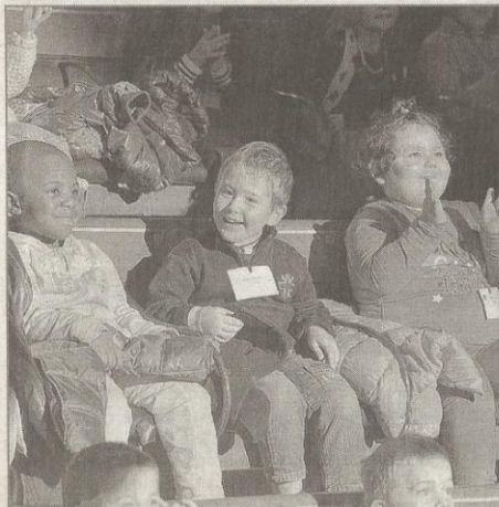
Entre stupeur ou émerveillement, le sourire lui, était toujours présent.