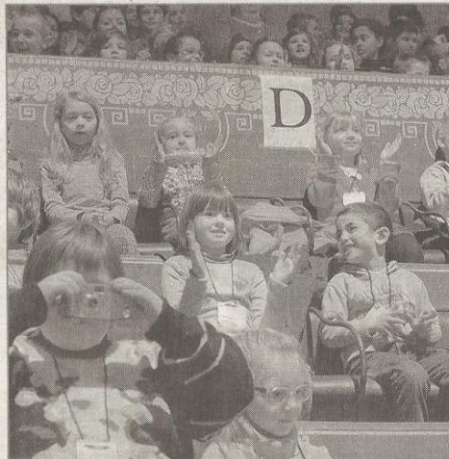
La magie du cirque suivra les élèves jusque dans les salles de classe.