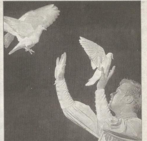
Les animaux ont rencontré un franc succès auprès des plus jeunes.