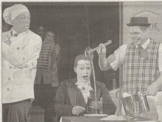
Les clowns, une valeur sûre auprès du jeune public... comme des plus grands.