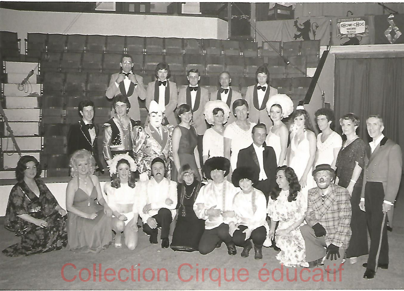
Collection Cirque éducatif