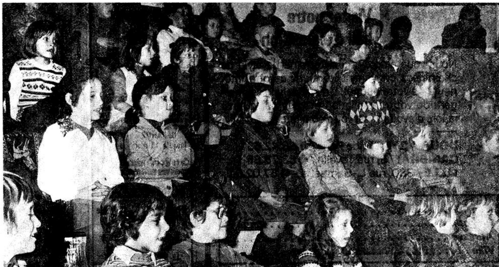
Pendant le numéro de dressage des lions...