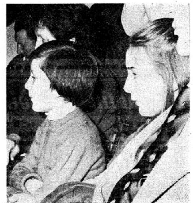
Des regards qui en disent long quant à la qualité du spectacle