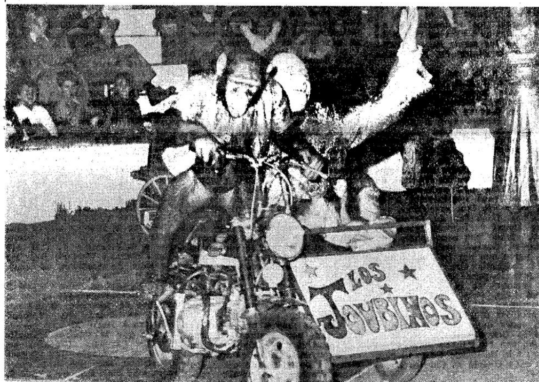
Un singe qui n'a plus rien à apprendre.